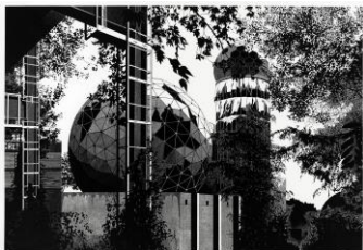
Claas Gutsche Leak, 2016 Linolschnitt auf Kozo-Papier, 250 x 375 cm Ed. 5 © Claas Gutsche Foto: Uwe Walter