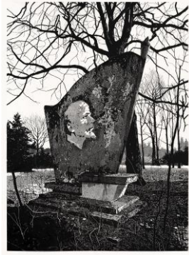
Claas Gutsche Die Idee, 2014 Linolschnitt auf Papier, 229 x 167 cm Ed. 5 © Claas Gutsche