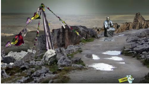
Ulu Braun Die Herberge (Silver), 2017 Still © Ulu Braun