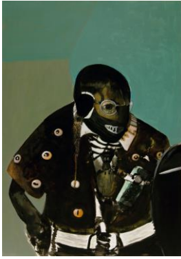
Thomas Rug Nr. 09 (Buttons) F, 2016 Acryl auf Papier, 100 x 70 cm © Thomas Rug