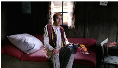
Ulu Braun Die Herberge (Tailor Asef), 2017 Still