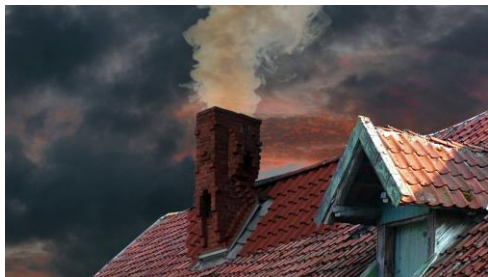
Ulu Braun Die Herberge (Der Kamin), 2017 Still © Ulu Braun