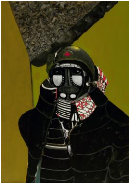
Thomas Rug Nr. 11 (Der Neue Rotarmist) F, 2017 Acryl auf Papier, 100 x 70 cm © Thomas Rug