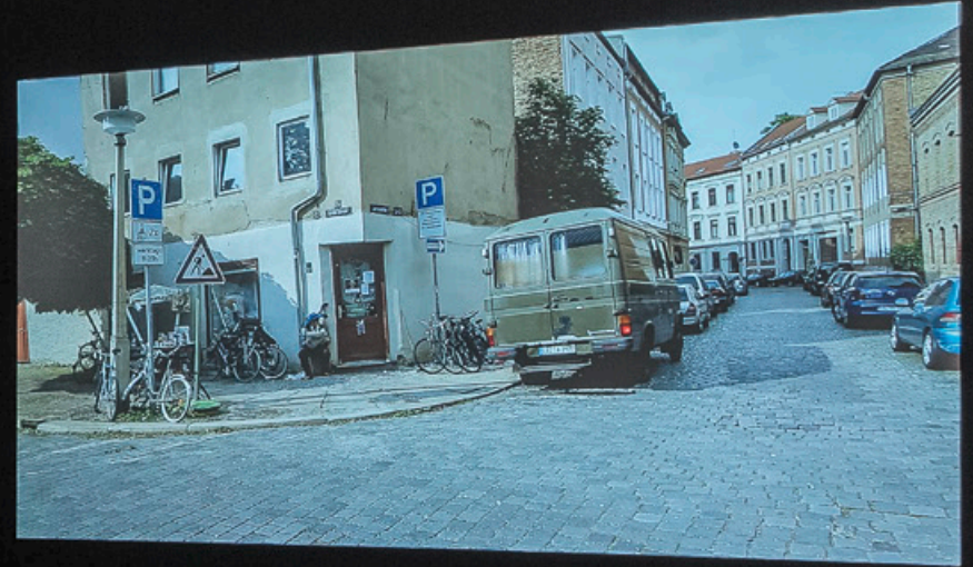
„Der Globus ist unser Pony. Der Kosmos unser richtiges Pferd“ | Ausstellungsansicht