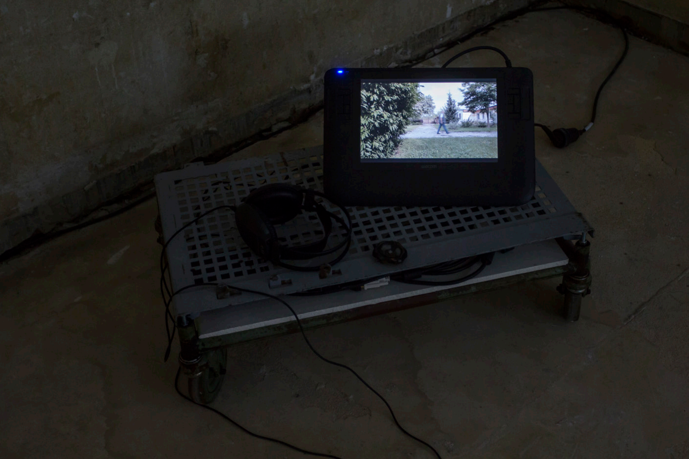
I KNOW YOU KNOW | Ausstellungsansicht mit Studienarbeit von Stephan Retzlaf