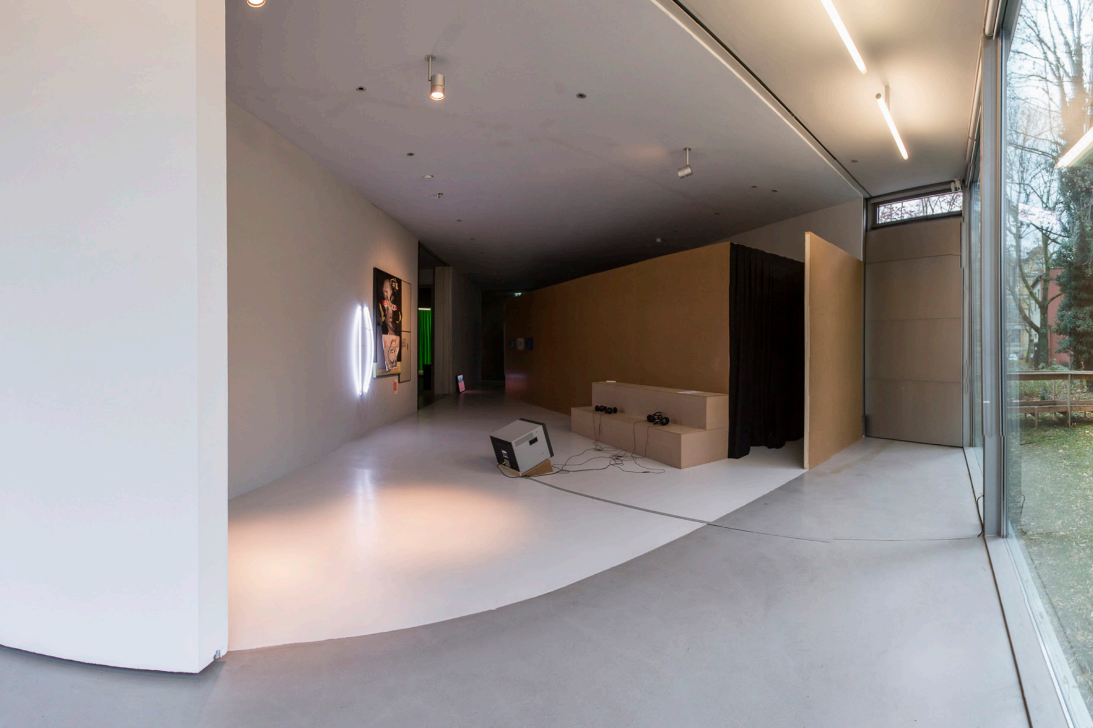
GFZK 2015 | Ausstellungsansicht mit Arbeiten der Studierenden