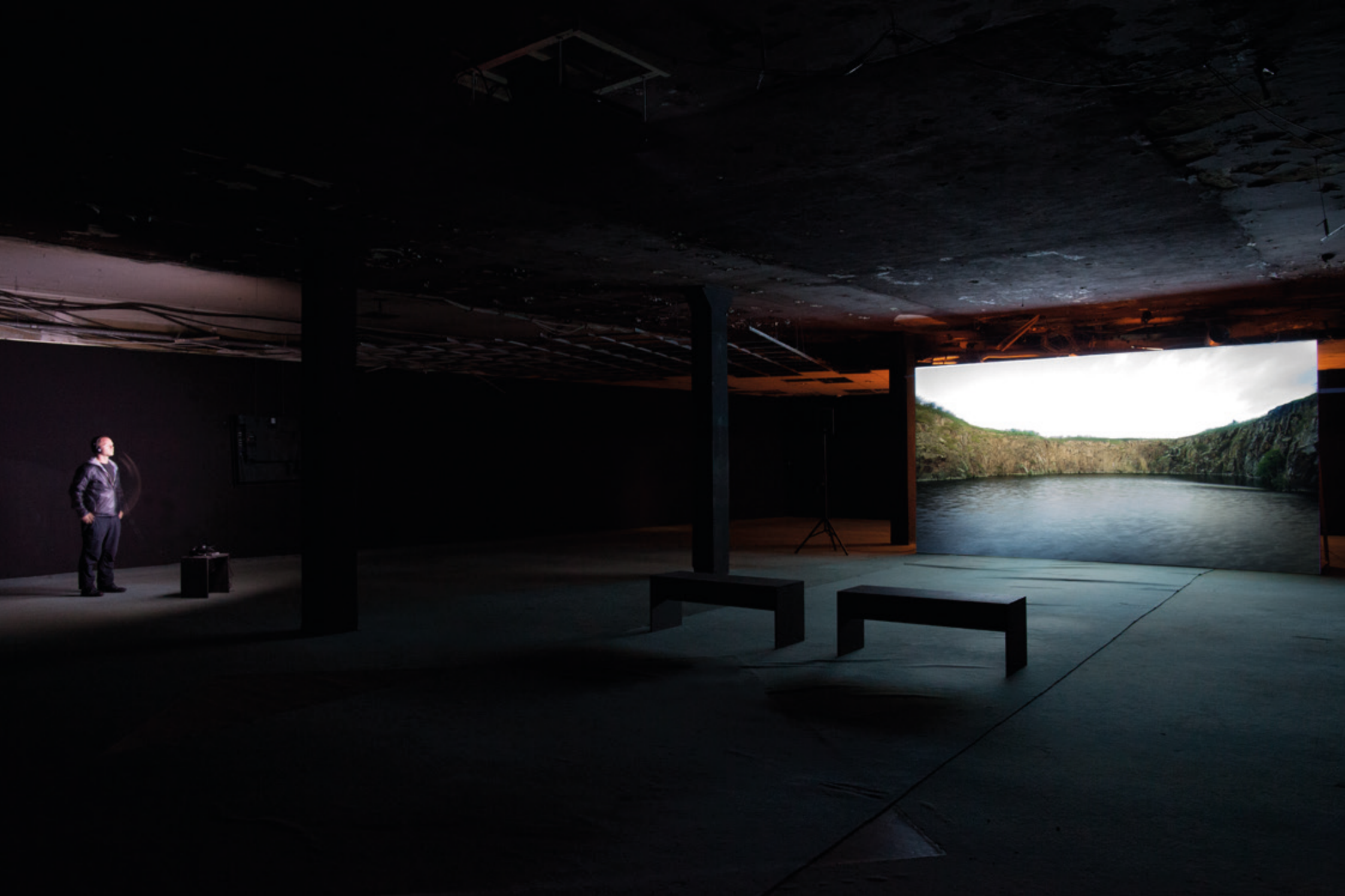
„Der Betrachter und sein Bild“ | Diplomarbeit Florian Schurz