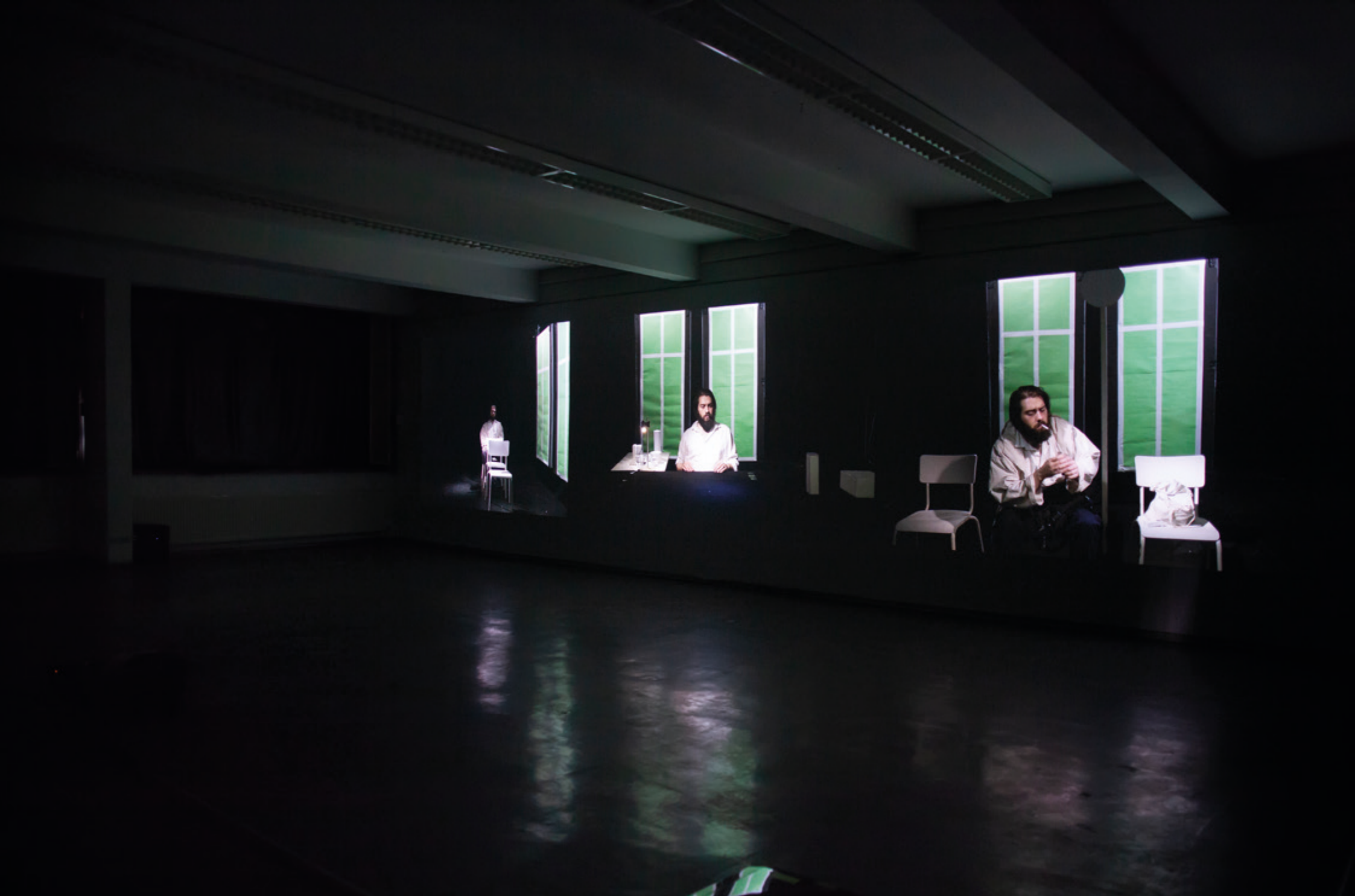
Jahresausstellung | 4-Kanal-Videoinstallation von Tim Thiel