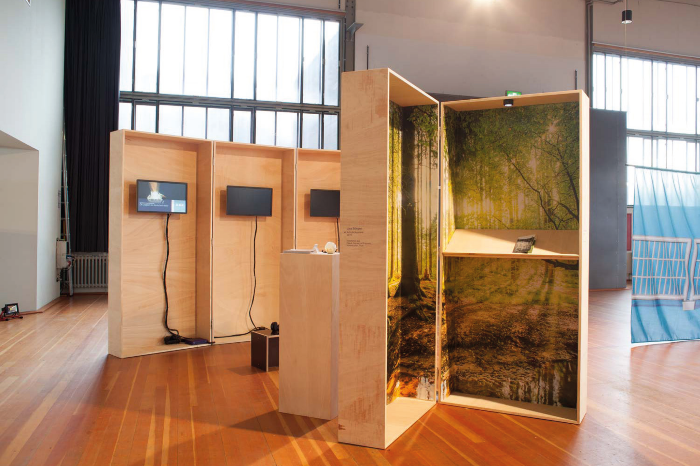
C.A.R. Essen | ausgewählte Arbeiten der Fachklasse