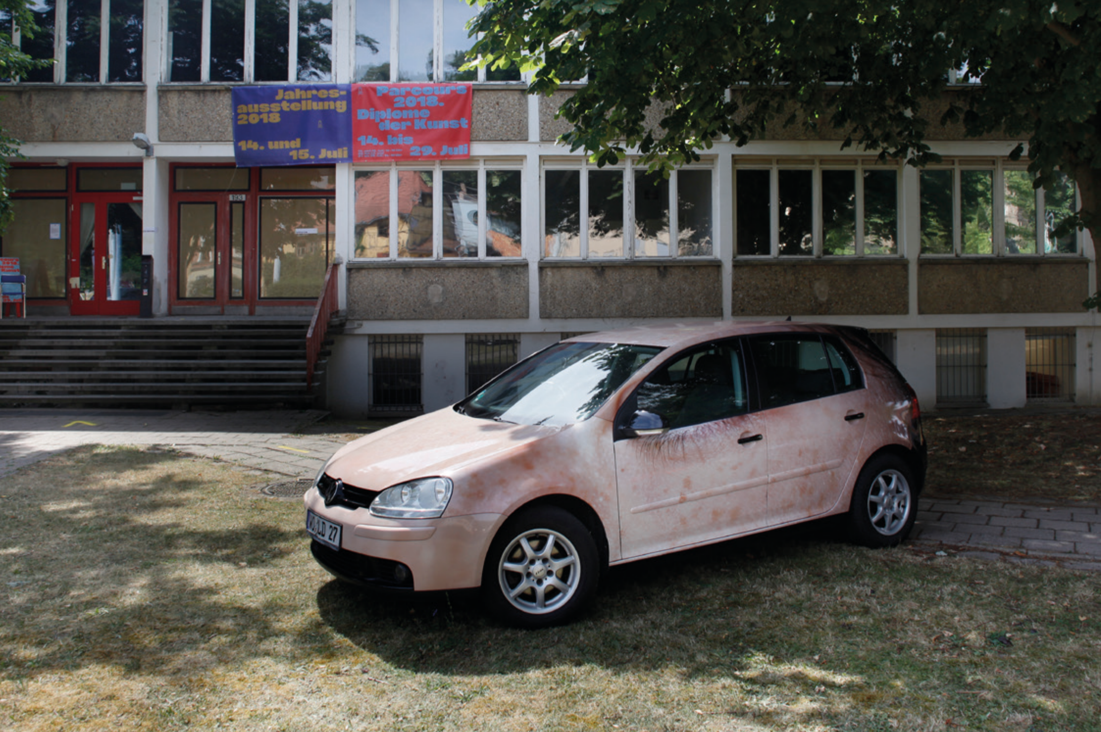
Jahresausstellung | Studienarbeit von Merlind Papke