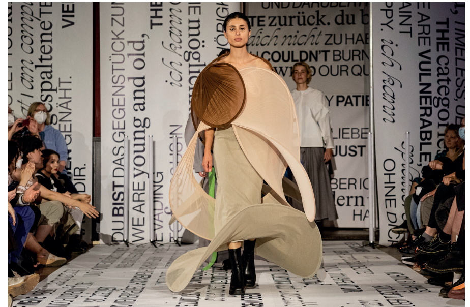
Carla Herring, Not all lines are straight, 2022, Foto/photo: Iona Dutz