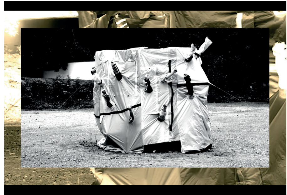
Anna Fenderl, FCK Apocalypse, entstanden im Projekt/developed in the project „Neuland/Science Fiction“.