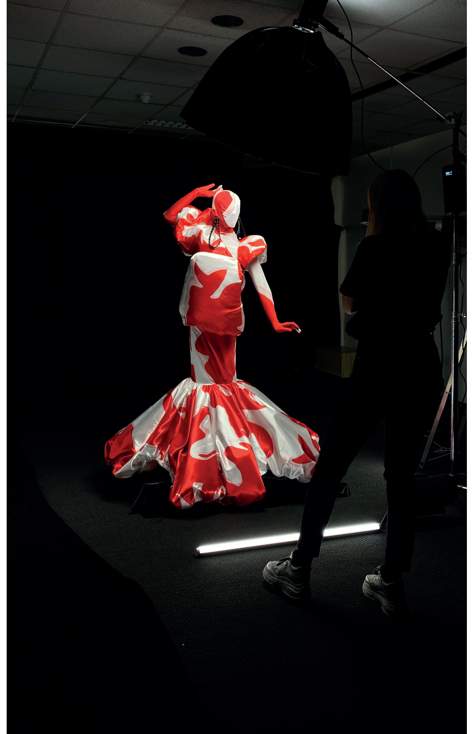
Entwurf/design Bokyoung Lim, Foto/photo: Sofia Löser