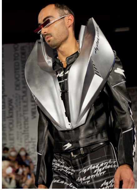
Lea Baz, Spatial Distortion, 2022, Foto/photo: Iona Dutz