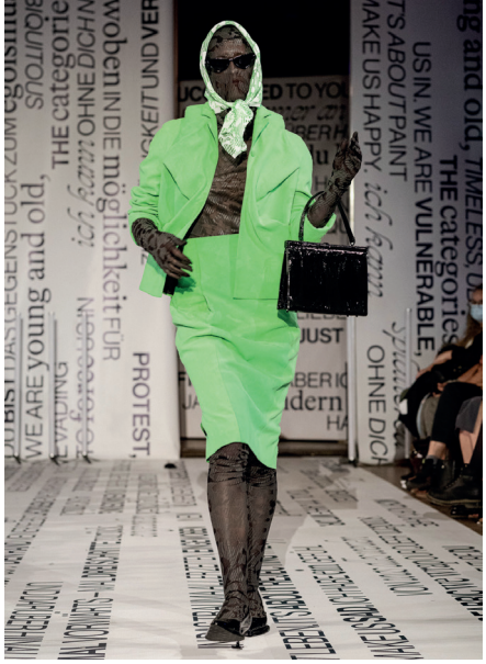
Franziska Bauer, VACUUM, 2022, Foto/photo: Iona Dutz