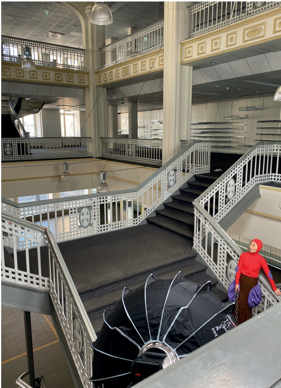
Rabea ter Braak, Belly of the Universe, B.A. Abschlussarbeit/thesis.