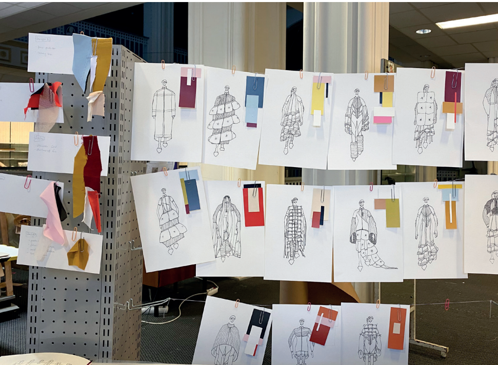
Entwürfe von/designs by Pia Haydn.

Die Studierenden werden durch komplexe Aufgabenstellungen und mit experimentellen wie produktbezogenen Projekten auf verschiedenste Betätigungsfelder innerhalb der Branche vorbereitet – sei es freiberuflich oder in einem Modeunternehmen.