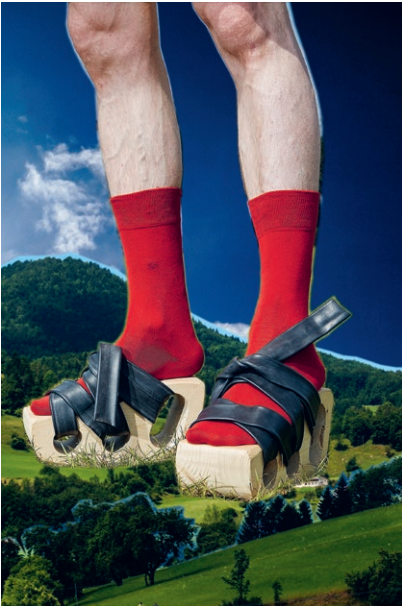
o. T. Untitled Paul Iby, 2016 Schuhe, shoes