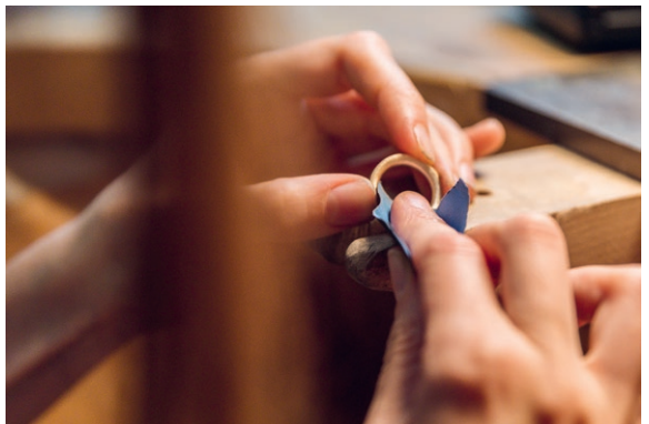
Feinschliff am Werkstück Polishing the workpiece

Jede/r Studierende erhält einen eigenen Arbeitsplatz Students have their own workstations