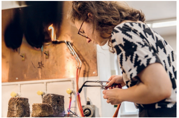
Studentin am Lötplatz Student at soldering bench

Die Goldschmiedewerkstatt ist ausgestattet mit Spindelpresse, Ziehbank, Walze, Amboss, Hämmern und vielen anderen Werkzeugen The goldsmith's workshop is equipped with a spindle press, draw bench, roller, anvil, hammers and many other tools