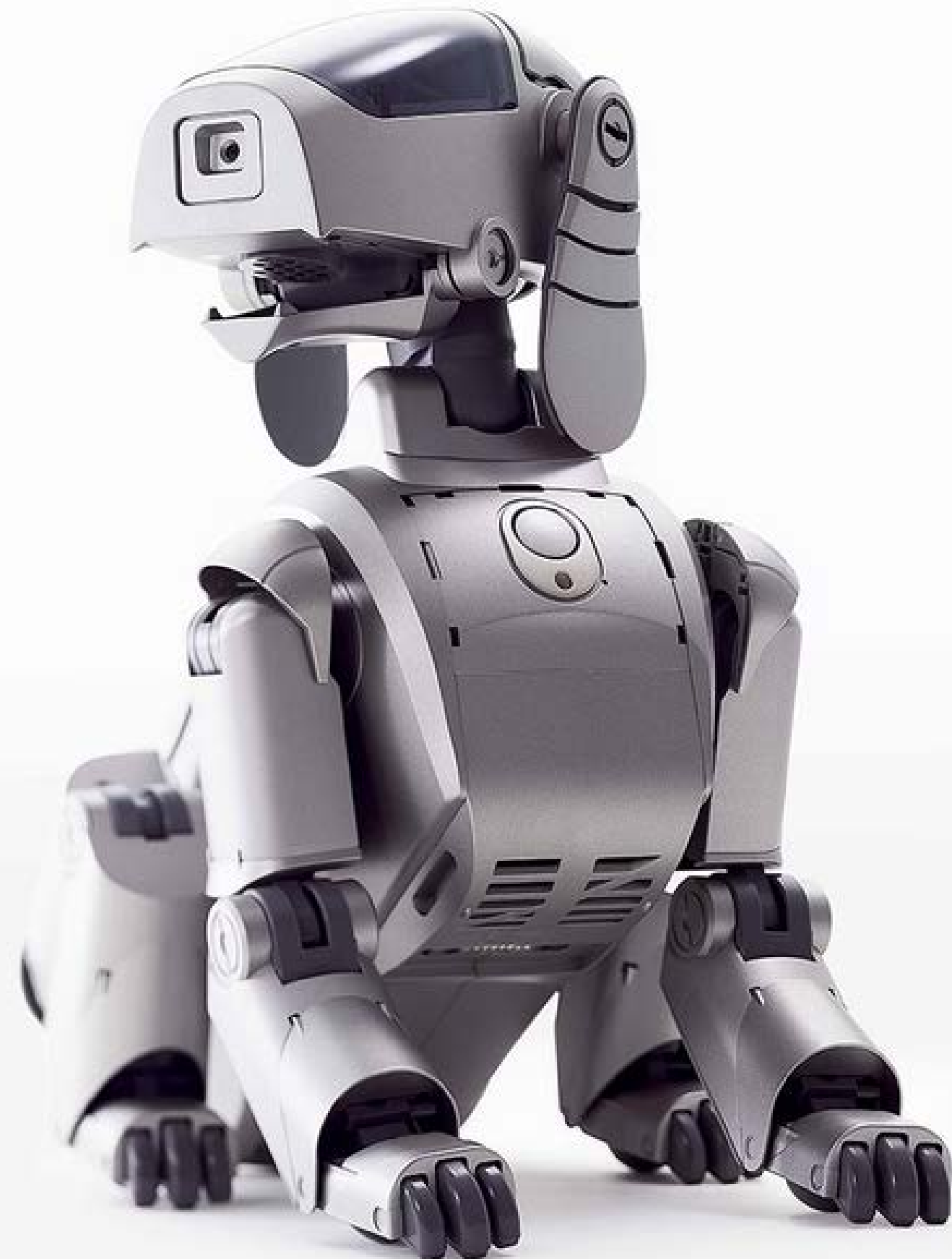
Alibo 1, Sony, 1999

ab 3. Studienjahr Bachelor-Studiengang ab 1. Studienjahr Master-Studiengang