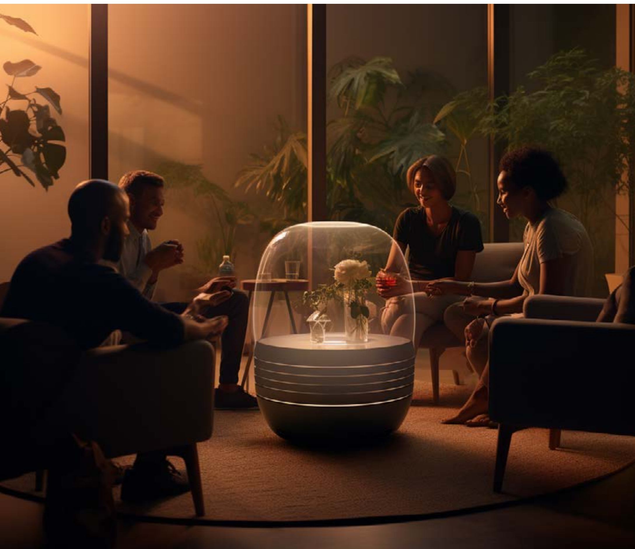
KI-generiertes Bild, Magischer Smart-Device, Midjourney 5.0, Prompt: A. Rex

ab 3. Studienjahr Bachelor-Studiengang ab 1. Studienjahr Master-Studiengang