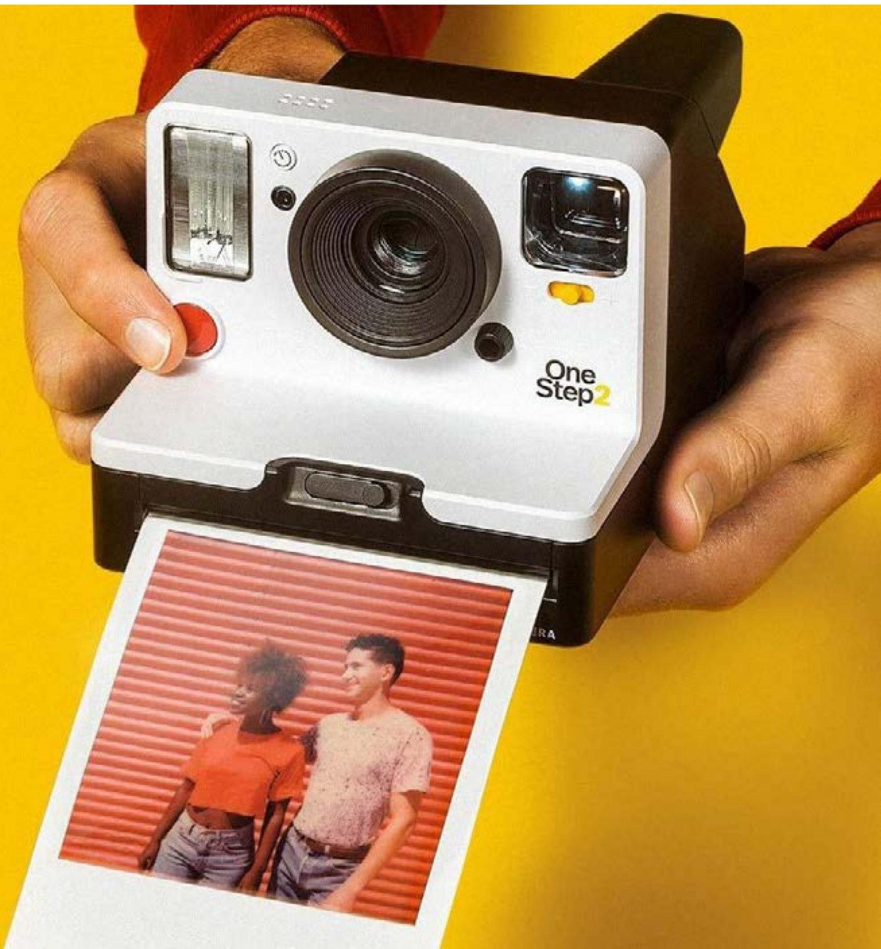
Polaroid Originals OneStep 2

ab 3. Studienjahr Bachelor-Studiengang ab 1. Studienjahr Master-Studiengang