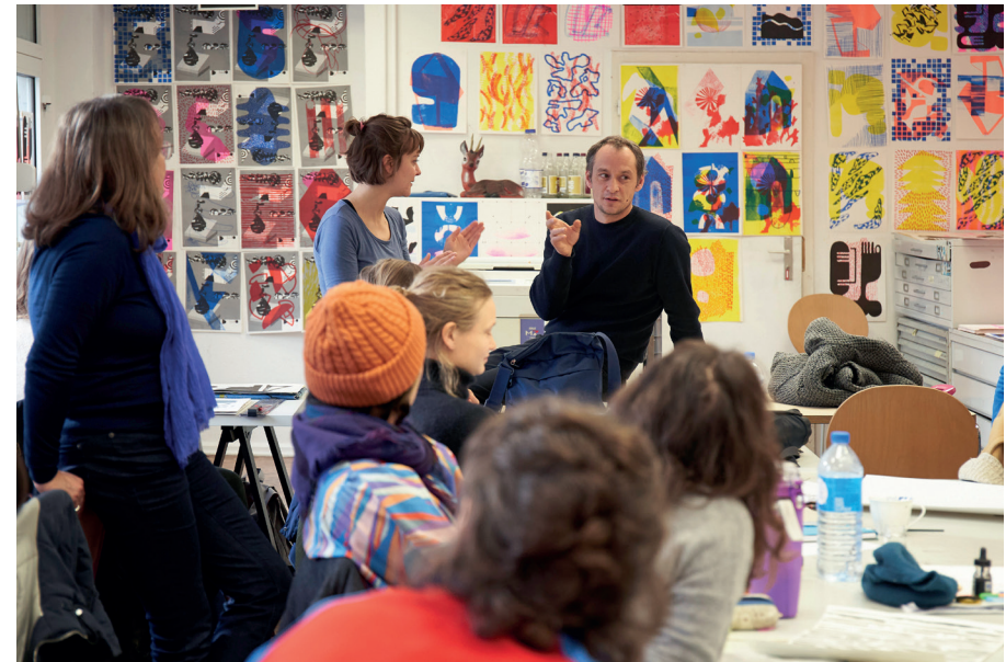
Workshop im Schwerpunkt Illustration, Wintersemester 2019/20 mit Aurélien Débat/Workshop illustration course, winter semester 2019/20 together with Aurélien Débat .