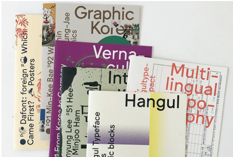
Jiheee, Somewhere in Between, entstanden im Sommersemester 2018, Schwerpunkt Schrift und Typografie, Foto: Jiheee Lee/Somewhere in Between, Summer semester 2018, type and typography course, Photo: Jiheee Lee

The Admission Test is held every March. It is possible to register online from December of the prior year.