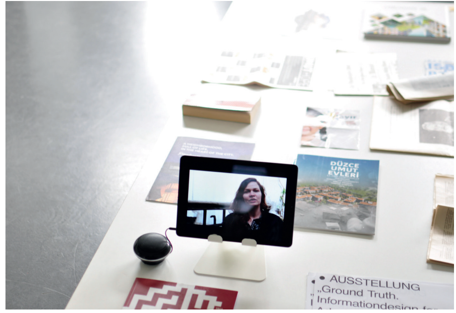
Jahresausstellung „Ground Truth“, Beitrag Schwerpunkt Informationsdesign in Zusammenarbeit mit Beyond Istanbul, 2017/Annual exhibition, "Ground Truth", work by the study course information design together with Beyond Istanbul, 2017