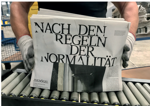
Projekt Schwerpunkt Fotografie und Informationsdesign gedruckt in der Sonderbeilage in der Mitteldeutschen Zeitung 17./18.7.2021/ Project focus on photography and information design printed in the special supplement in the Mitteldeutsche Zeitung 17./18.7.2021.

Exceptionally well-equipped workshops provide ideal conditions for the study programme: from a photo lab and computer pool, the university printing press with offset, lead type, and screen printing workshop to a digital workshop and model workshops for wood, metal, and plastic. At BURG , students also benefit from exchanges with other design and art courses while working on projects and collaborating with students from Fashion Design, Interior Architecture, or Time-based Arts.