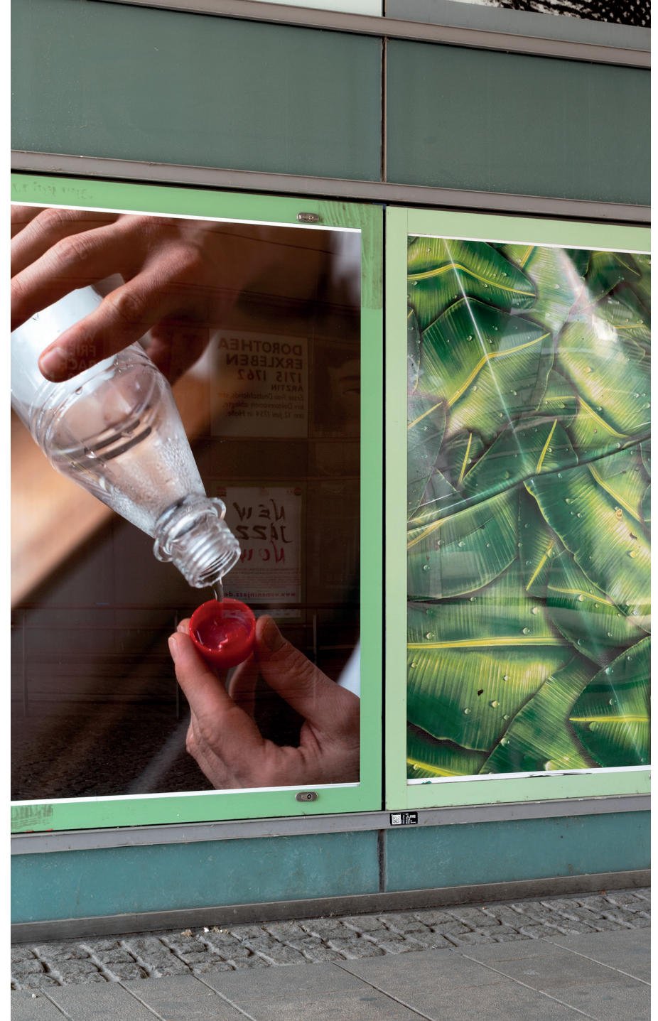
Johannes Kapp, Processing.... Plakatinstallation des Schwerpunkts Fotografie am Riebeckplatz Halle (Saale)/ poster installation of the photography course at Riebeckplatz in Halle (Saale), 2022.

→ www.burg-halle.de/kommunikationsdesign