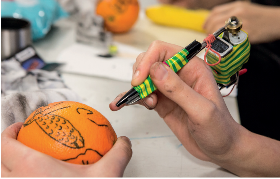
Workshop „How to Knast-tattoo“ im Schwerpunkt Illustration, Wintersemester 2017/18 mit Torsten Illner & Andreas Theile/workshop "How to Knast-tattoo" in the illustration course winter semester 2017/18 together with Torsten Illner & Andreas Theile, Foto/photo: Tobias Jacob