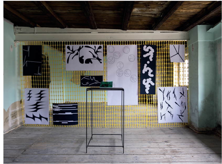
Marie Schuster, Modes of Writing Bachelor Abschlussarbeit, entstanden im Sommersemester 2019. Foto: Marie Schuster/Marie Schuster, Modes of Writing Bachelor degree, Sommer semester 2019. Photo: Marie Schuster