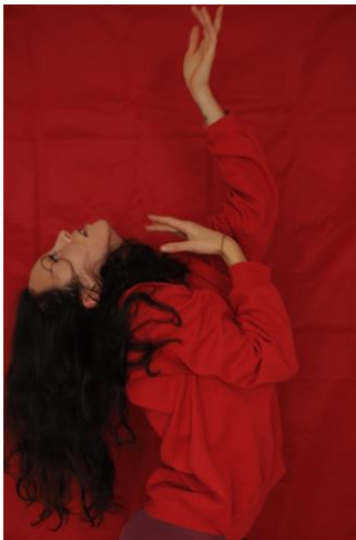
Anna Martynenko Farben der Emotionen, 2017 Archival-Pigment Druck