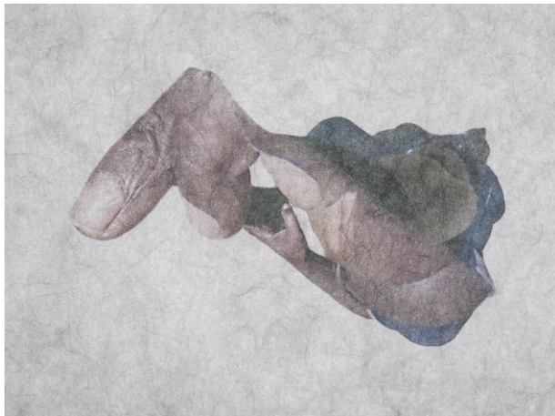
Tim Bruns Novae Terrae, 2017 Archival-Pigment Druck © Tim Bruns