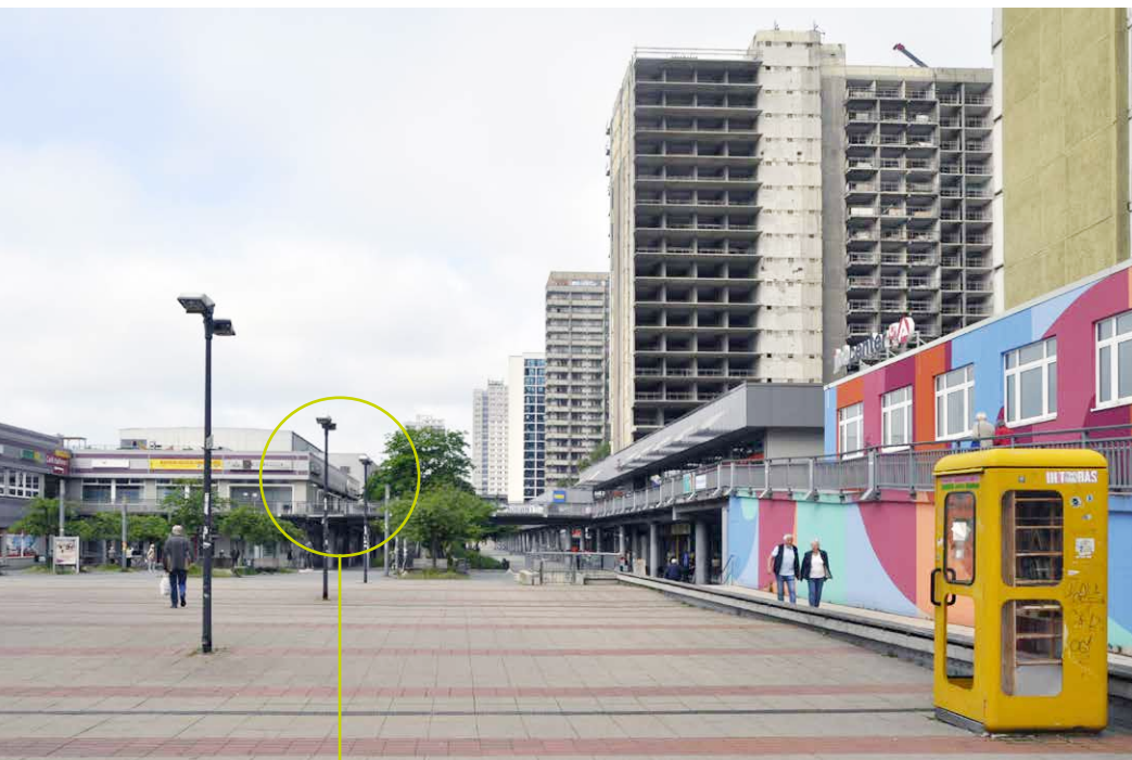
Neustädter Passage: rechts säumen vier Scheibenhochhäuser die Fußgängerzone