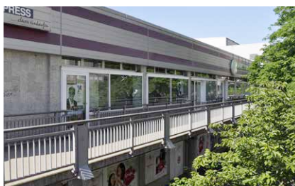
Leerstand im OG1 der Fußgängerzone