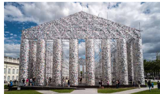
Parthenon of Books von Marta Minujin Dokumenta 14, Kassel