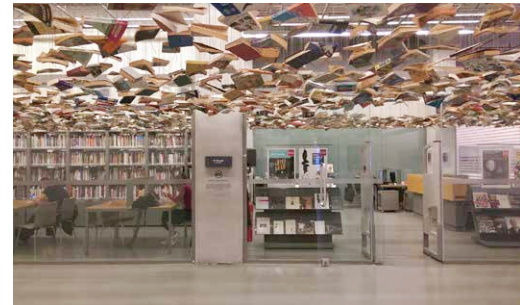
Museumshop Istanbul Modern, Istanbul