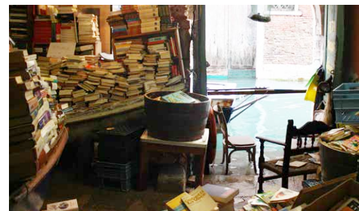
Buchladen Aqua Alta, Venedig