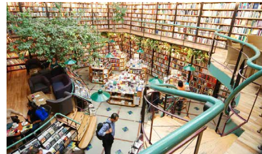
Cafetrería El Péndulo, Mexico City