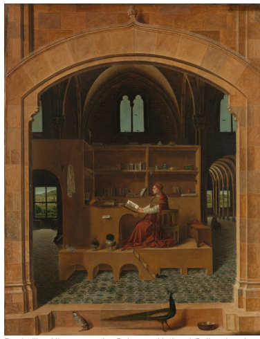
Der heilige Hieronymus im Gehäuse, National Gallery London