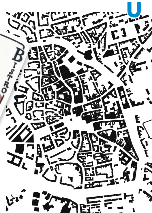
Schwarzplan Innenstadt Halle