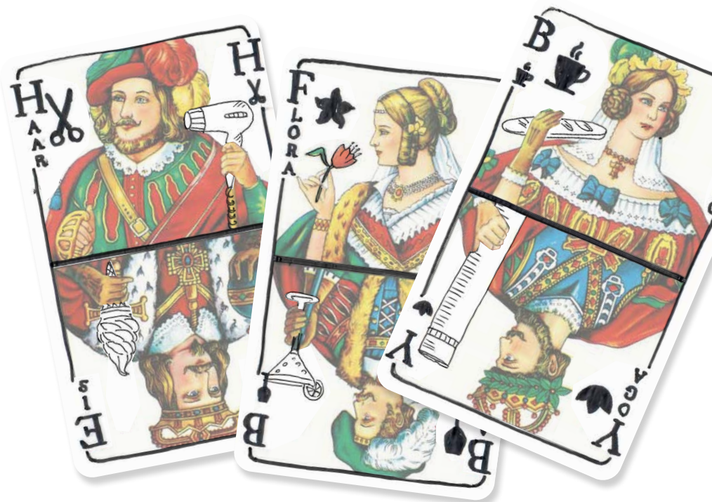
Illustration Doppelnutzung: Rita Rentzsch

Timesharing-Modelle für lebenswerte Innenstädte