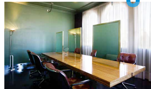
Haarsalon, Francesc Pons, Barcelona 2001