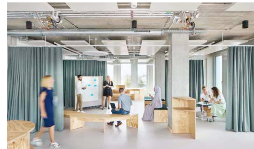
Henning Larsen und Ramboll, München 2024