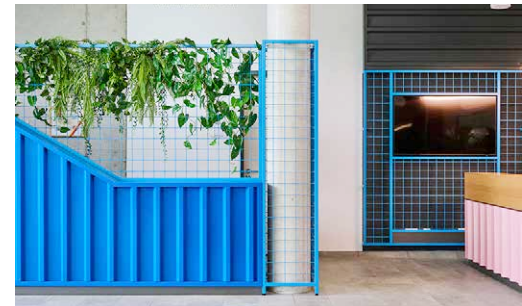
Start-up Campus, brandherm + krumrey, Paderborn 2024