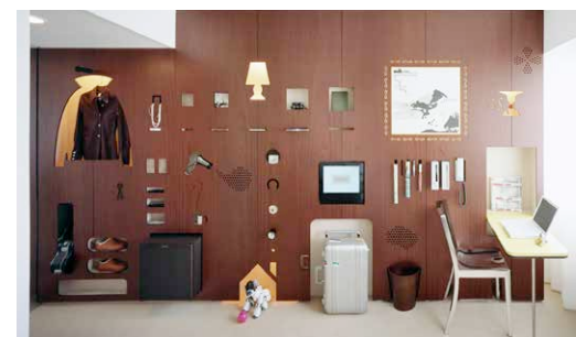
Hotel Claska, Shinya Kamuro, Tokyo 2004