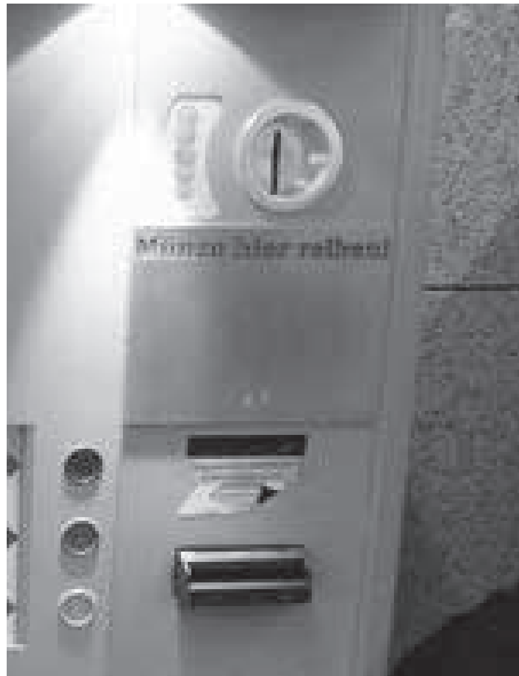
04 Vandalismus als Inspiration zur Innovation