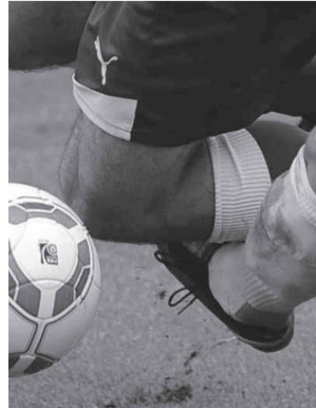
10 Regelverstoß als Teil des Spiels?