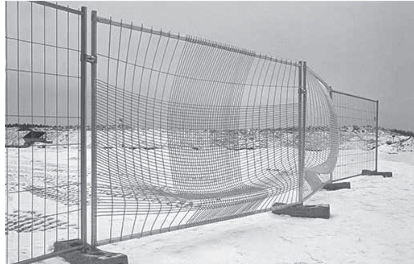
02 Funktionale Erweiterung, umdeuten, umfunktionieren, umnutzen, umgestalten...