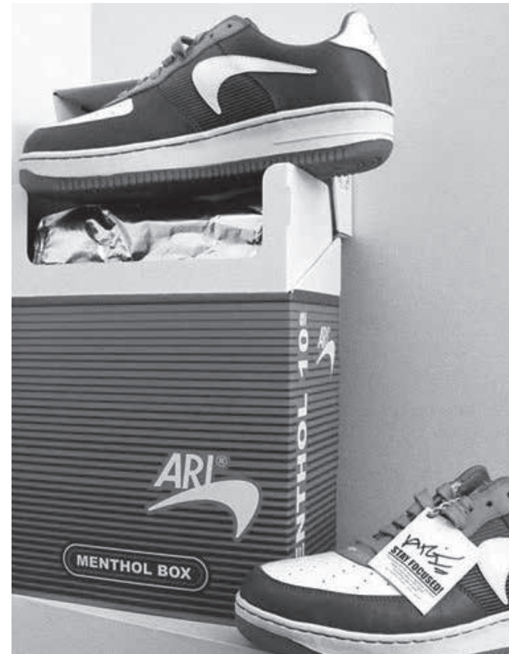
09 Plagiatismus oder Parodie?