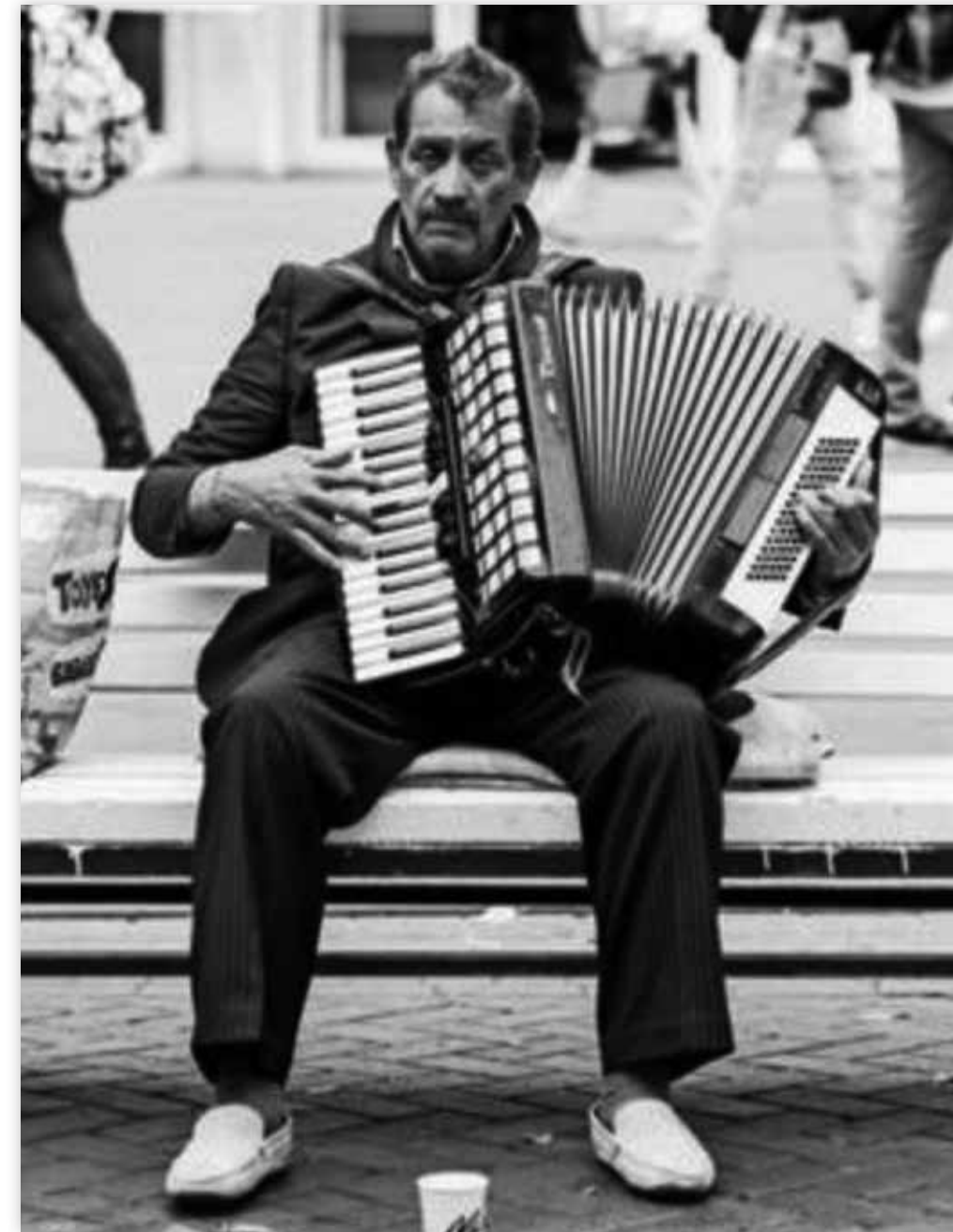
13 musizieren und betteln erlaubt?