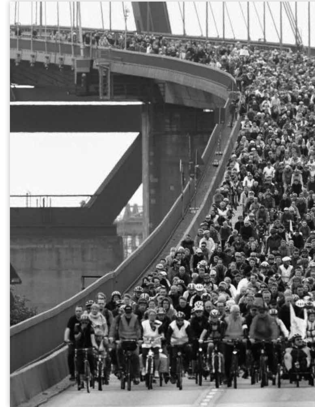
14 critical mass?