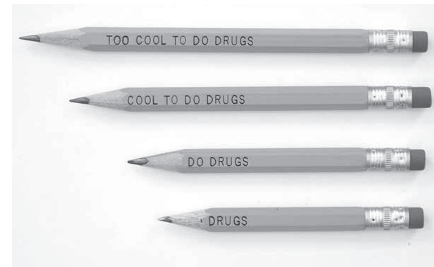
06 (un)bedachte Botschaft?