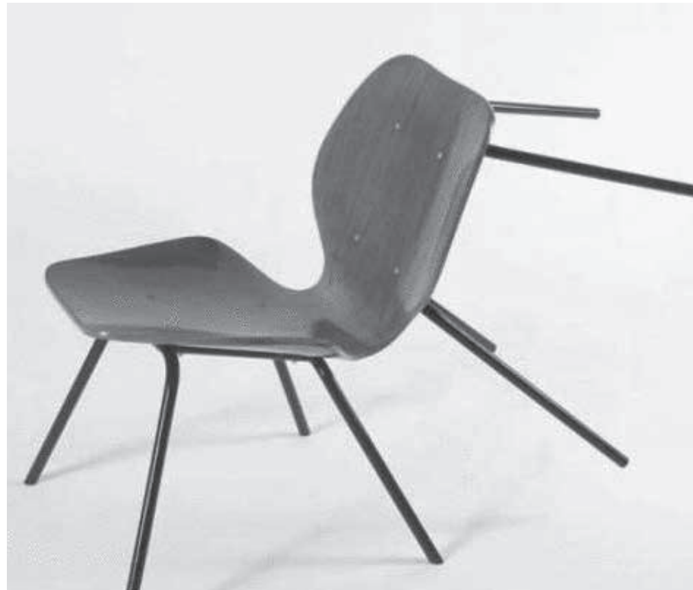
01 Kippen erwünscht! Verhaltensregeln in Frage stellen!