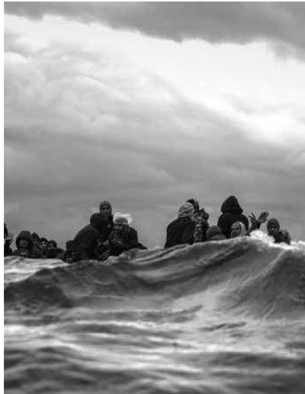
12 Flucht und Rettung?