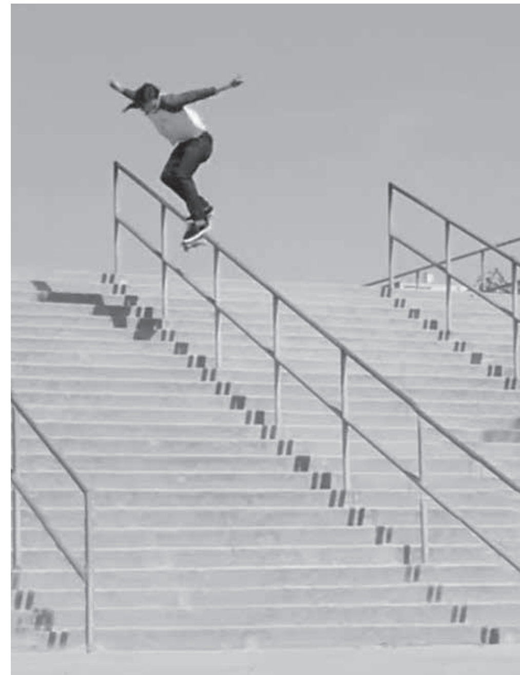
05 alternative Nutzung als Sportgerät?