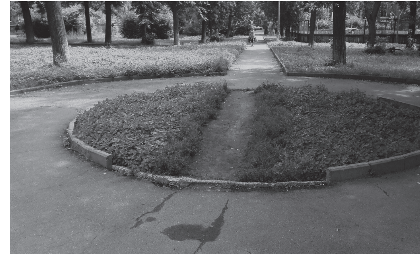
07 Querbeet-Trampelpfad: user experience vs. Stadtplanung