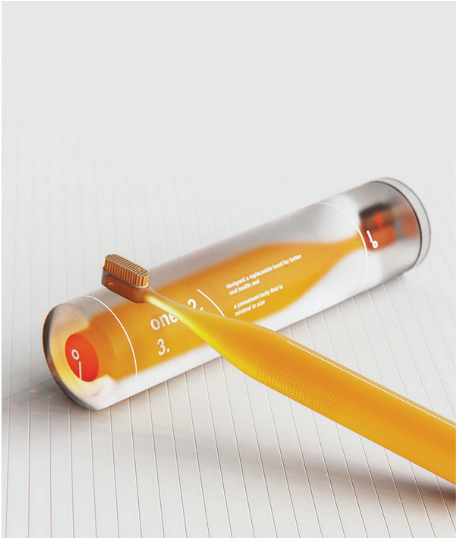
one 2 3 -Zahnbürste - nuone design