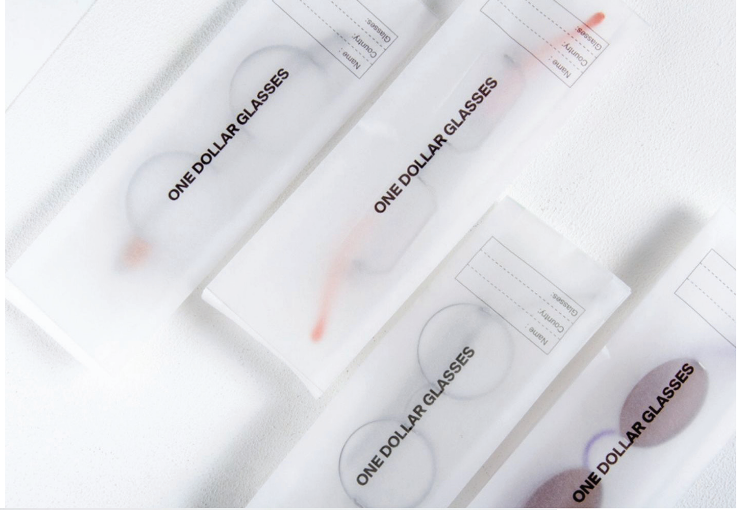
one dollar glasses - Haus Otto