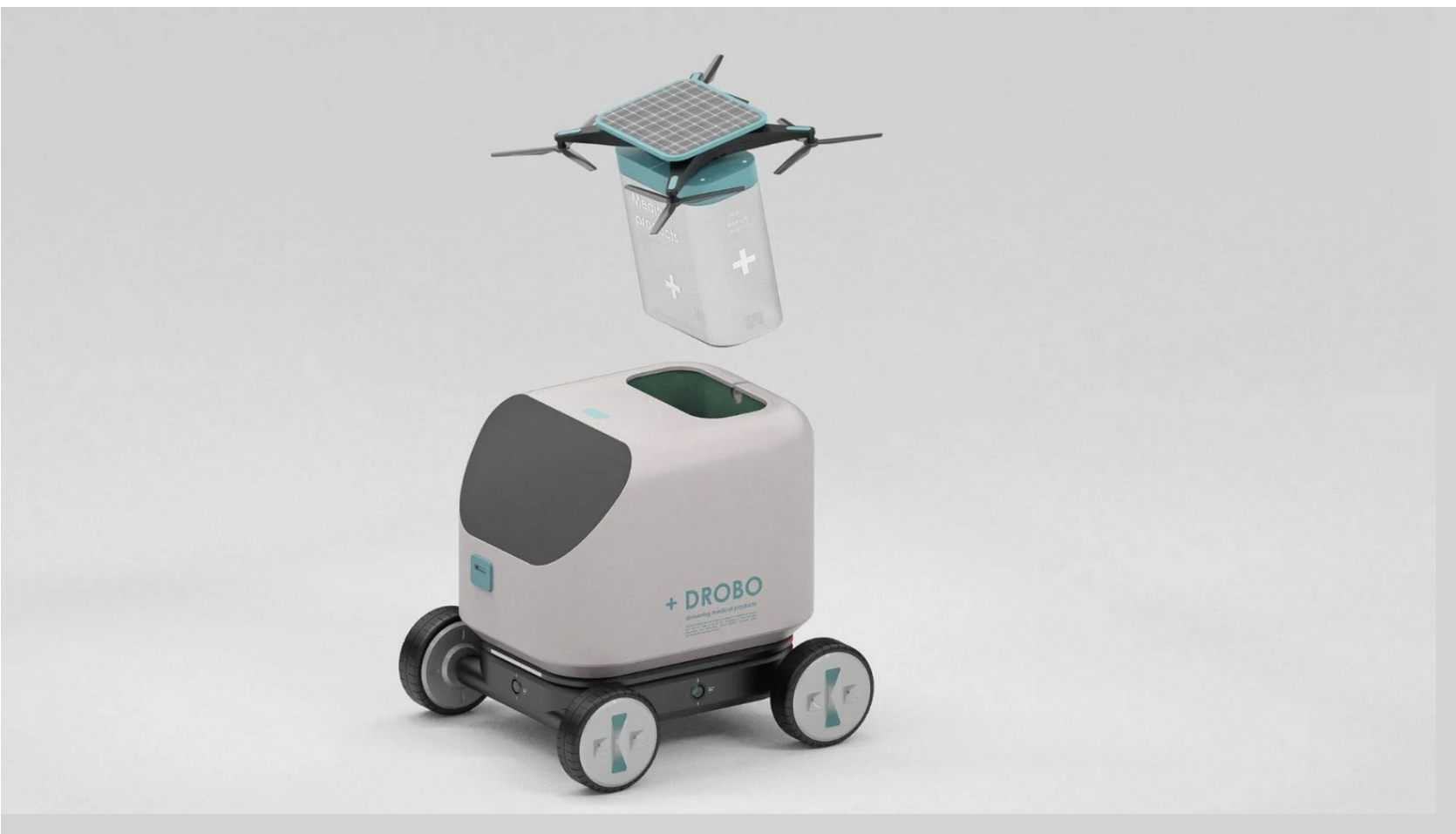
Drobo, Nuone Design