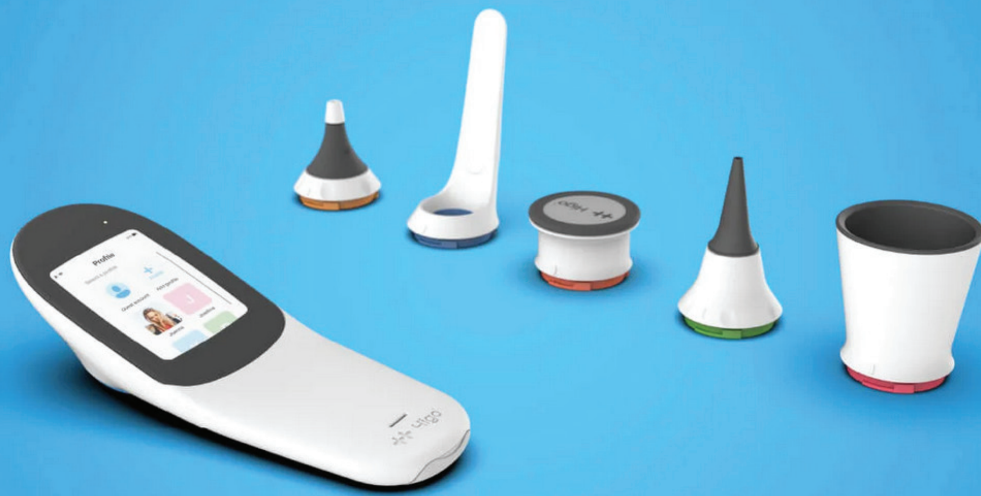
Higo Sense - digital doctor in your pocket

ab 3. Studienjahr Bachelor-Studiengang ab 1. Studienjahr Master-Studiengang