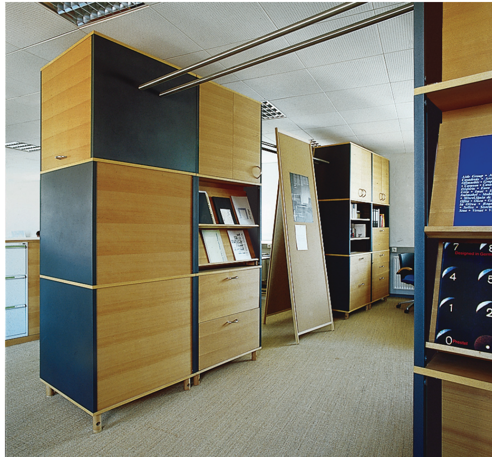
Einrichtungs-Konzept „Türme und Traversen“