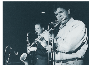
Einige der Referenten von links nach rechts: Philippe Kahn, Niklaus Wirth, Marvin Minsky, Joseph Weizenbaum