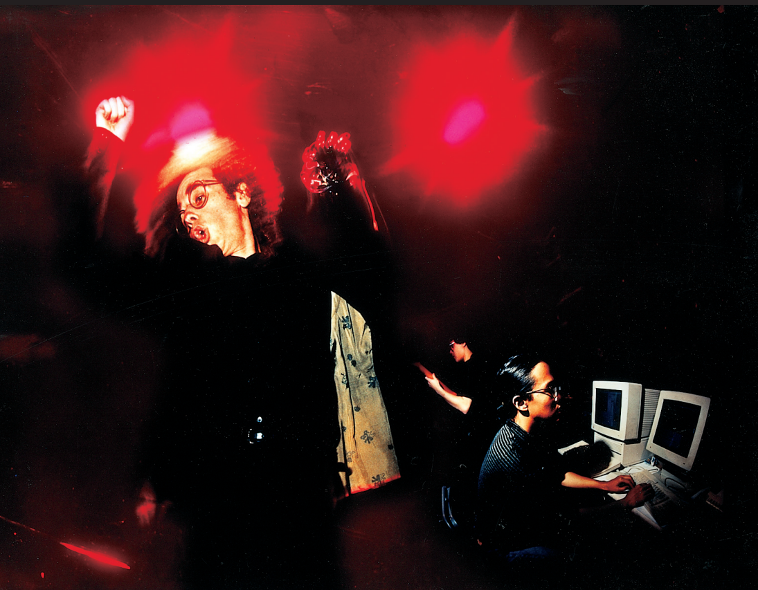
Tod Machover dirigiert ein Ensemble aus Musikern und Computern mit dem Datenhandschuh ...