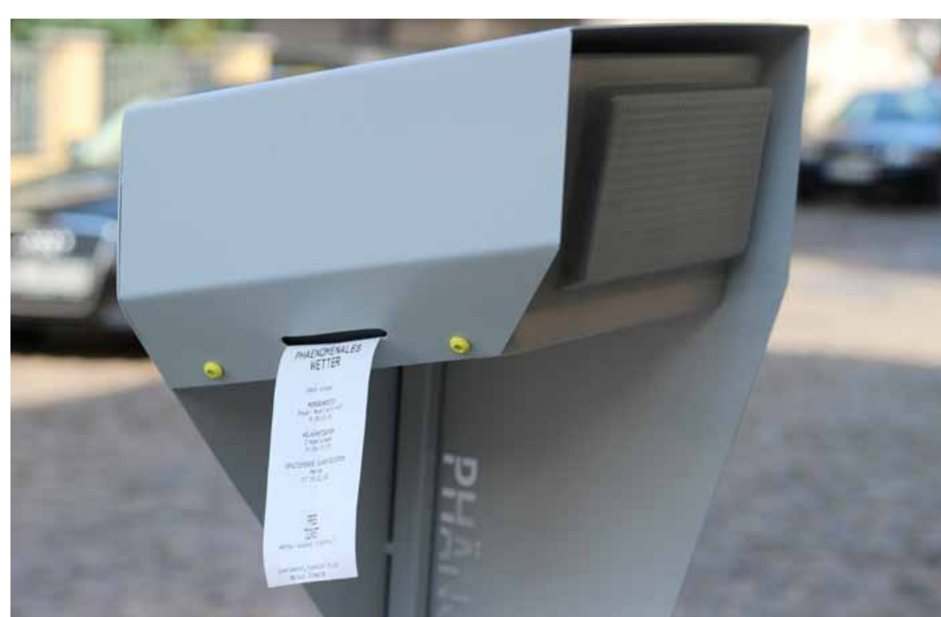
Phänomene Tankstelle mit Bon zum ausdrucken