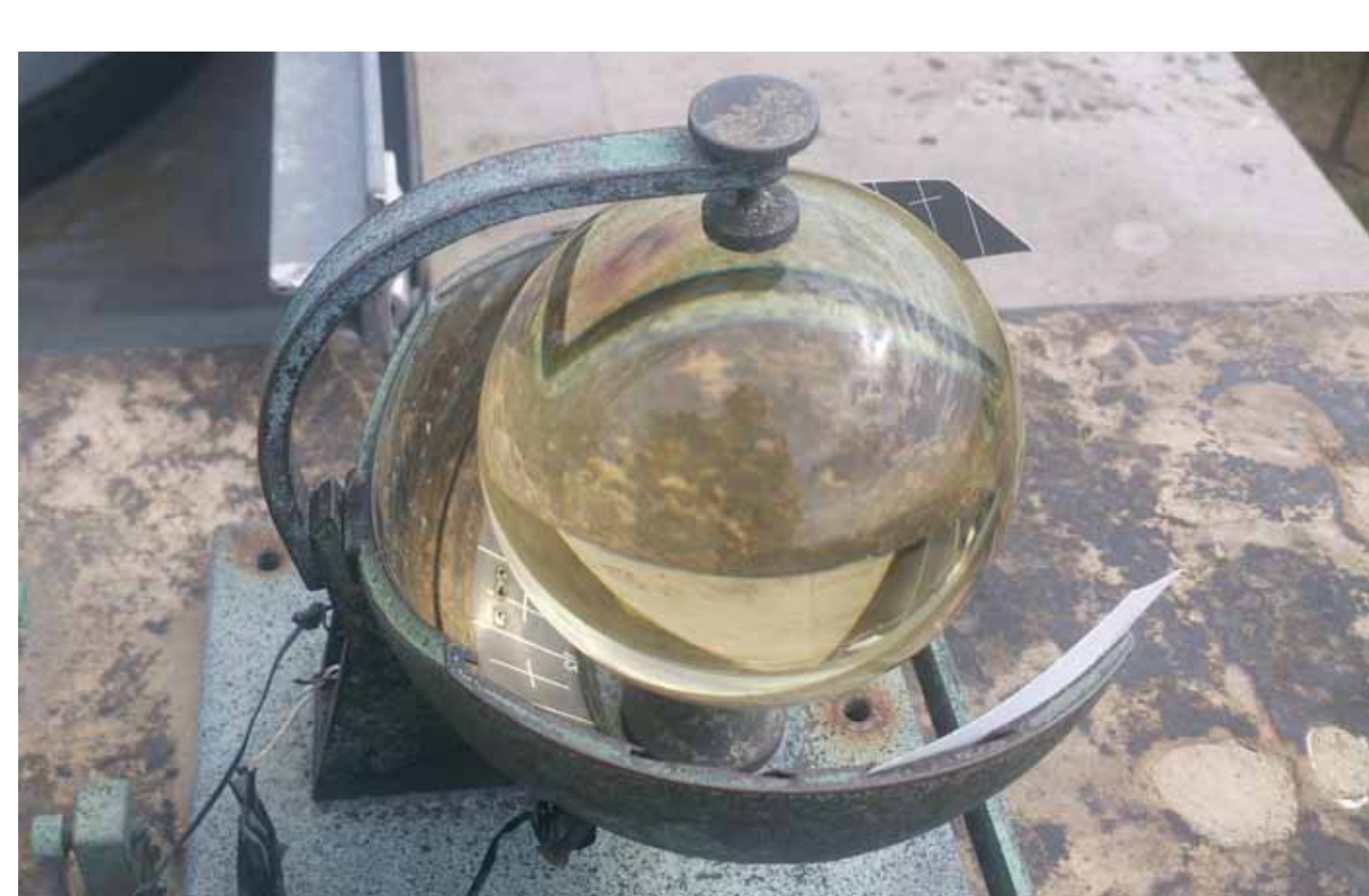
Heliograph – Sonnenschreiber beim Deutschen Geo Forschungs Zentrum in Potsdam